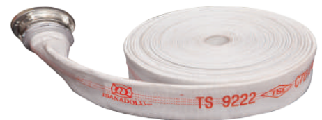
İÇİ KAÜÇUK YANGIN HORTUMU ISLAK ALARM VANALARI