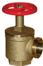
KAT BAĞLANTI VANASI