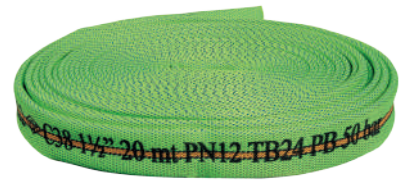
MASTER YANGIN HORTUMU