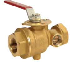
TEST VE DRENAJ VANASI