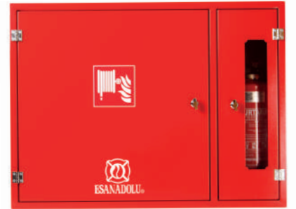
CAM KAPAKLI YANGIN DOLABI