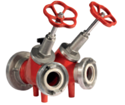
İKİLİ DAĞITICI (Salmastra Vanalı)