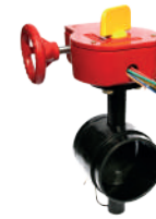
İZLENEBİLİR KELEBEK VANA (Yivli)