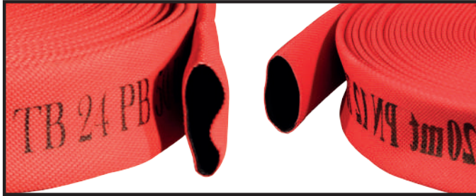
İÇİ PVC YANGIN HORTUMU (Kırmızı Pu Kaplı)

Hortumlar inç'lerine göre: 20-25-30 mt uzunluklarında imal edilir. Özel olarak formüle edilmiş termo-kauçuk karışımı kullanılarak "through-the-weave" ekstrüzyon yöntemiyle tek adım üretim yöntemi kullanılır. Sürtünme kaybını azaltan pürüzsüz iç katman ve yağlara, kimyasallara ve sürtünme dayanımını arttıran özel kaplama bulunur. Zararlı kimyasalların dokuma katmanına zarar vermesini engelleyen gözeneksiz dış katmana sahiptir. Daha düşük (-30°C) sıcaklık dayanımı sağlayabilen özel formül ile üretilmektedir.