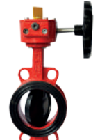
İZLENEBİLİR KELEBEK VANA (WAFER)