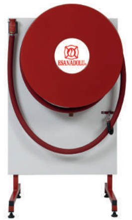
AYAKLI SABİT YANGIN HORTUMU