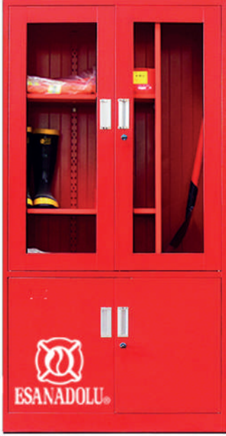
YANGIN EKİPMAN DOLABI