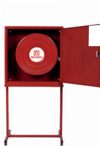
AYAKLI YANGIN DOLABI