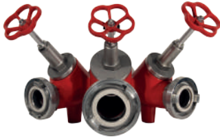
ÜÇLÜ DAĞITICI (Salmastra Vanalı)