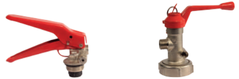
CO2 YSC TETİĞİ