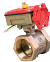
İZLENEBİLİR KELEBEK VANA (Dişli)