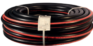
YARI SERT YANGIN HORTUMU