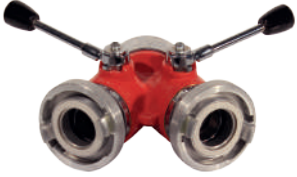
İkili Dağıtıcı Küresel Waygate