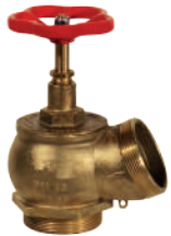
YARIM DİŞ RAKORSUZ YANGIN VANASI