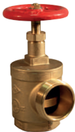
KÖŞE HORTUM VANASI