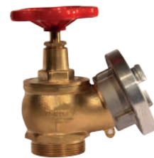
YARIM DİŞ RAKORSUZ YANGIN VANASI