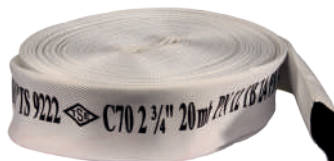
İÇİ KAÜÇUK YANGIN HORTUMU