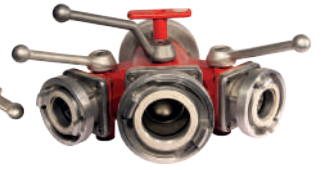
ÜÇLÜ DAĞITICI (Küresel Vanalı)