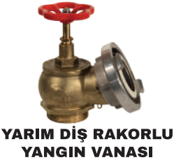
YARIM DİŞ RAKORLU YANGIN VANASI